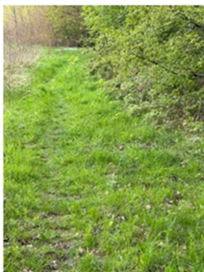
neu geschaffener Trampelpfad